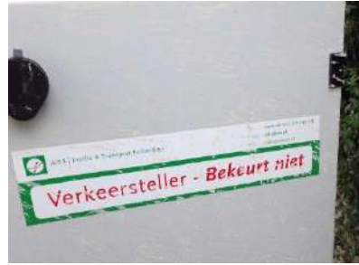
Eind augustus stond deze verkeerstellingsinstallatie aan het begin van het Vagantenpad. De uitslag van de telling is ons niet bekend.