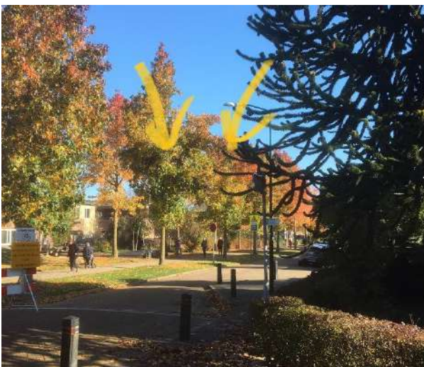
Eerst streken ze vaak neer op de Marskramerbaan, toen op het Eikenpad en het Grunoplantsoen en in november werden er opeens 5 uilen gespot in 2 bomen aan de Pastoor Heggelaan. Ze waren wel lastig te fotograferen

Wij vinden dit jammer, maar wensen Krommerijnwijk Groen veel succes.