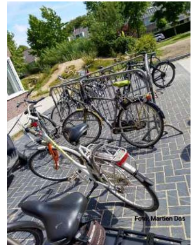
Het was in het begin een beetje een rommeltje als je je fiets wilde stallen bij het Gezondheidscentrum. Begin september is dat opgelost en is de fietsenstalling inmiddels volop in bedrijf.

Op 5 september was de officiële start van de werkgroep Biodiversiteit: Een imker gaf in de buitenlucht (i.v.m. corona) uitleg over wat biodiversiteit is en wat je kunt doen in je eigen tuin. Zo spelen bijv. niet alleen bloemen een rol, maar ook hoogteverschillen tussen bomen en planten. Zoals je in deze Bezem kunt lezen is de werkgroep inmiddels los van de wijkvereniging verder gegaan onder de naam Krommerijnwijk Groen.